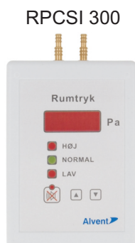
Tryckregulator med tryckindikering och tryckgivare